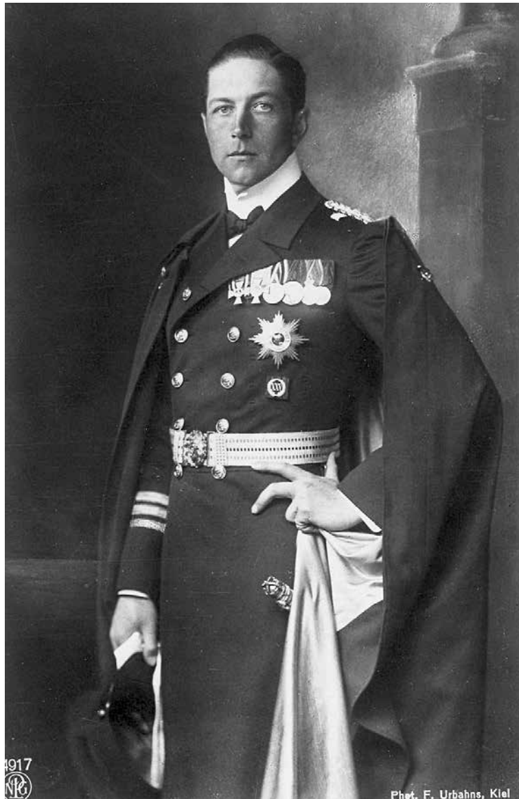
Prinz Adalbert von Preussen

1864 hatte die Preußische Marine mit dem Allgemeinen Marine-Befehl Nr. 108 (16.11.1864) die Einstellung und Ausbildung der Maschinisten-Applikanten angeordnet.