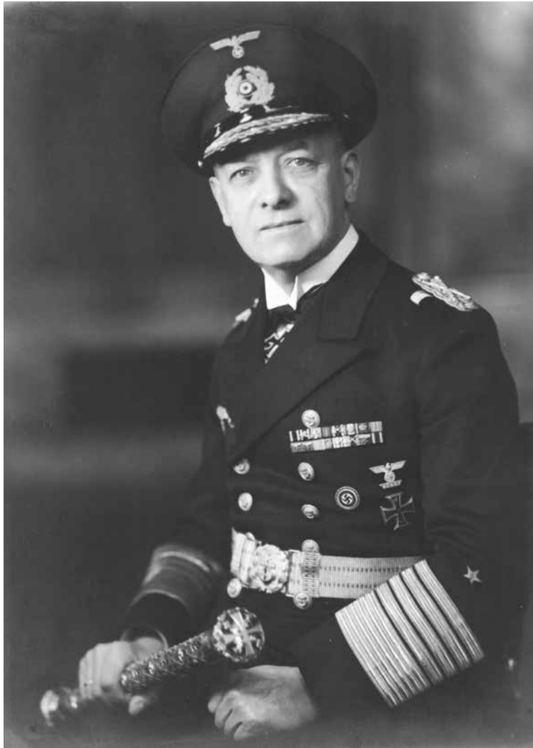
Großadmiral Erich Raeder