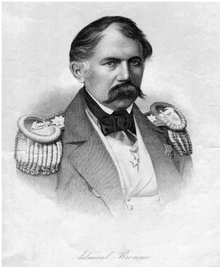
Konteradmiral Karl Rudolf Brommy

Offiziersrang zu bekleidenden Maschinenmeister-Chargen, ..., noch ausgesetzt wird. Die Vorschläge bedürften noch näherer Erörterung und Begründung“ (1).