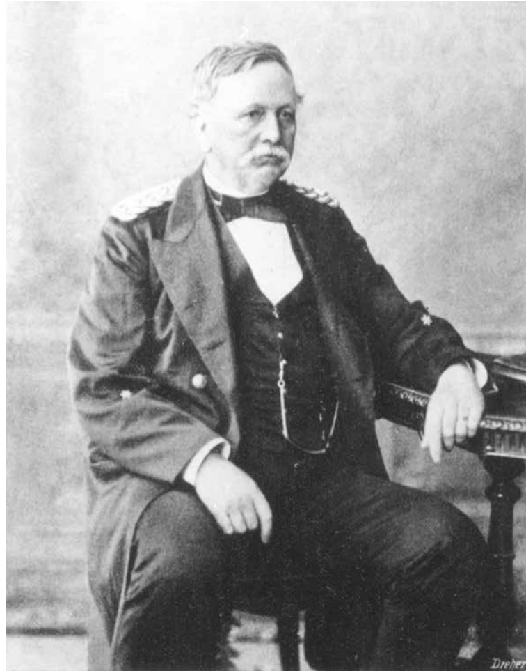
Admiral Albrecht von Stosch

welchen Gründen auch immer“), sondern wurde zum General-Inspekteur der Marine ernannt, womit ihm praktisch jede Möglichkeit der Einwirkung entzogen war.