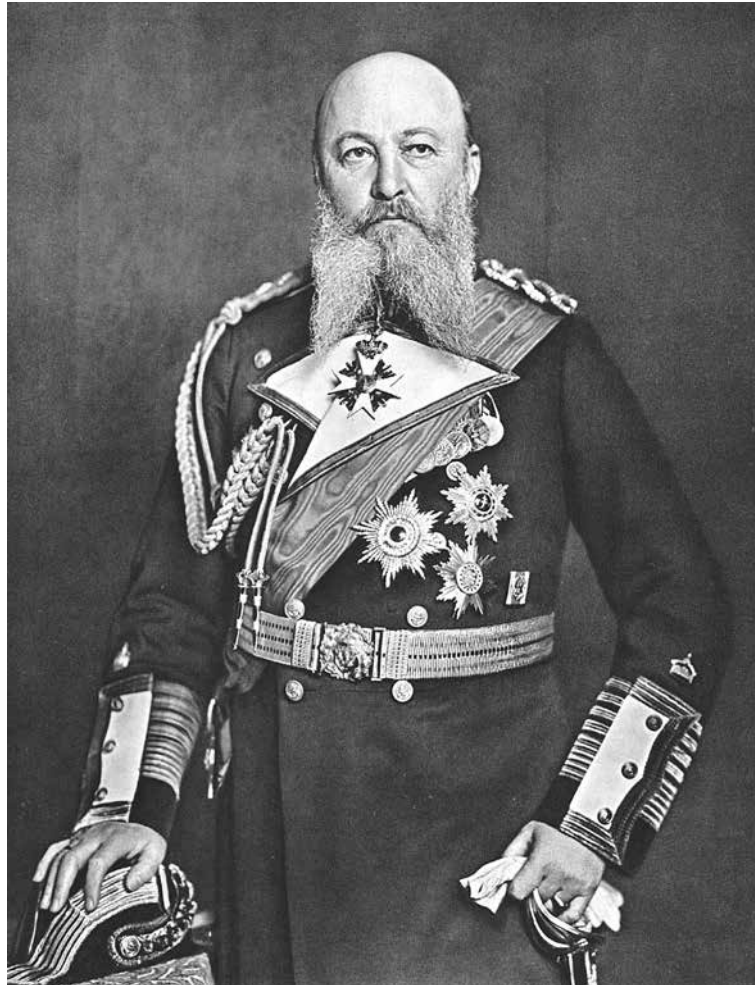
Großadmiral Alfred von Tirpitz

eines Kriegsschiffes gewissermaßen auch gleich zu achten sein dürfte. Diese Begründung war neu und für die damalige Zeit ungewöhnlich. (1)